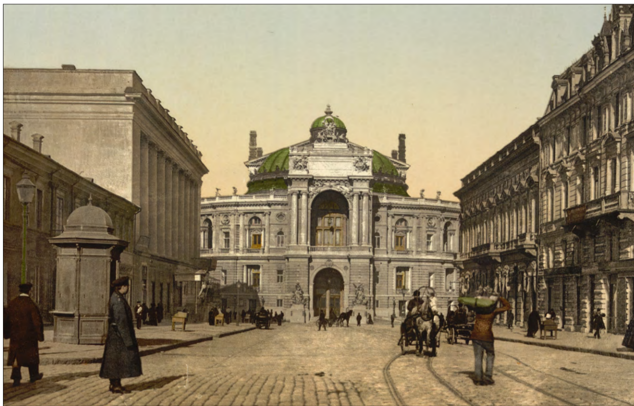
Odessa vers la fin dal 19avel tschientaner.

A partir da l'onn 1850 èn var 200 creschids ed uffants tujetschins emigrads en ils Stadis Unids da l'America. Là han els fundà dretgas colonias rumantschas – ils nums da questas colonias regordan anc oz a quel temp da pioniers e da novs